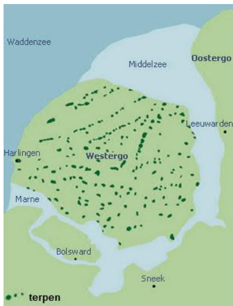
TERPENRIJEN IN WESTERGO

De Middellzee (een middeleeuwse zeearm) deelde het noordelijk deel van de huidige provincie Friesland in tweeën. Het gebied westelijk van de Middellzee is Westergo, oostelijk van de Middellzee ligt Oostergo. Door overstromingen en afkalving van de oevers bij stormvloed was de Middellzee een steeds grotere bedreiging gaan vormen voor de bewoners van het omringende land. Om hun gebied te beschermen, begonnen de bewoners van Oostergo en Westergo vanaf de 11e eeuw dijken aan te leggen. In de daarop volgende eeuwen werden de Middellzee en de Marne ingepolderd, waardoor Westergo aan de rest van Friesland vast kwam te zitten.