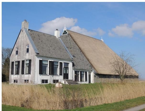
HEEMSTRA STATE IN KIMSWERD

Een akkerbouwbedrijf heeft een verlengd voorhuis met extra opslagruimte voor graan boven de woonvertrekken en grotere ramen aan de achterkant van de schuur, die als dorsruimte werd gebruikt.