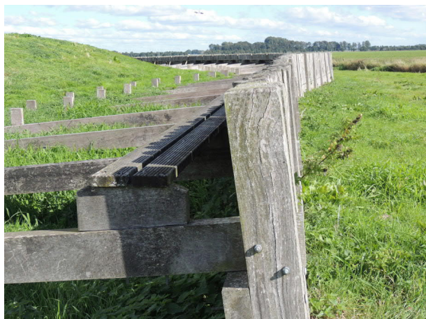
PALENSCHERM MET LOOPPLANK (RECONSTRUCTIE)

Het noordelijke hoger gelegen deel van het eiland (Emmeloord) onderhield betrekkingen met Amsterdam. Het zuidelijke lager gelegen deel van het eiland (Ens) handelde met de steden langs de IJssel.