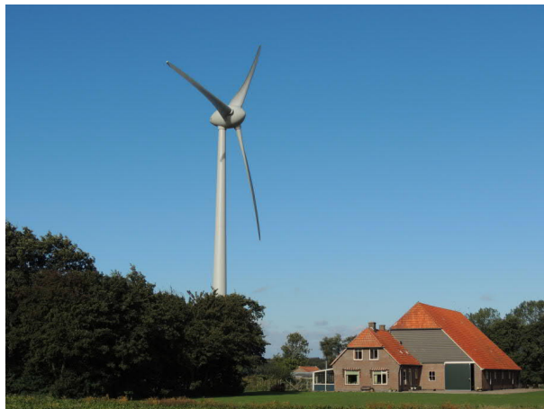
WIERINGERMEERBOERDERIJ ANNO 2016

De dorpen werden, evenals de boerderijen, planconomisch aangelegd. Het bestuur bepaalde waar en hoeveel dorpen er kwamen en hoe de dorpen werden ingericht.