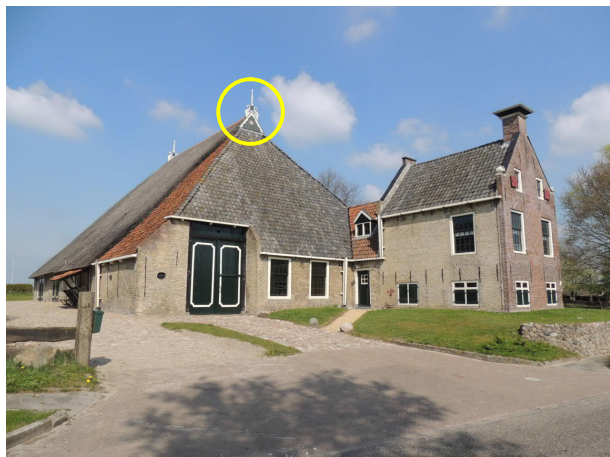
KOP-HALS-ROMPBOERDERIJ IN SONDEL

De kop-hals-rompboerderij is ontstaan uit de langhuisboerderij, een boerderij waarbij woon- en bedrijfsgebouwen onder een doorlopend dak liggen. Door de betere landbouwmethoden in de 16e eeuw ontstond er behoefte aan meer opslagruimte voor de oogst. Hieraan werd voldaan door achter het woongedeelte aan de zijkant van de schuur een stuk aan te bouwen. Hierdoor ontstond de kop-hals-rompboerderij, waarbij het woongedeelte niet recht voor de schuur staat. Bij latere, geheel nieuwgebouwde boerderijen, blijft deze opzet gehandhaafd. De onderdelen van een kop-hals-rompboerderij zijn functioneel: wonen in de kop (voorhuis), werken in de hals en oogstopslag en veestallen in de romp (schuur).